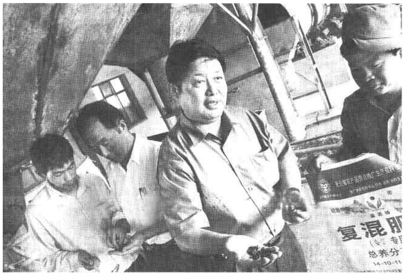
东营市农源肥业有限责任公司生产的“盈源牌”复混肥被省里列为“无公害农产品重点推广生产资料”之后,他们更加注重质量意识,确保品牌信誉。图为技术人员正在认真化验配方成分。