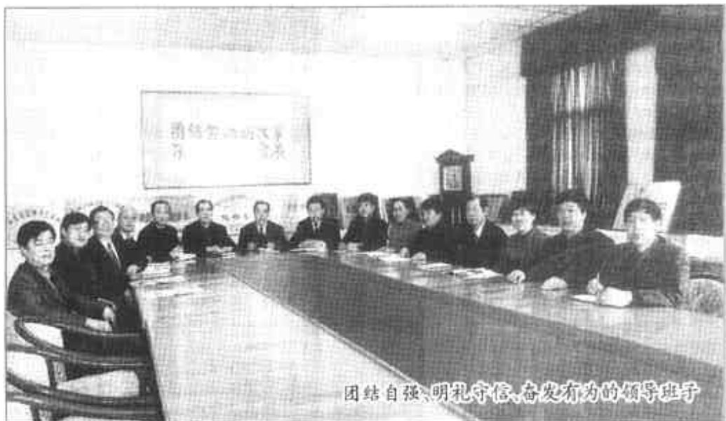
团结自强、明礼守信、奋发有为的领导班子

人、财、物等各类经营管理活动实施全方位和有效的科学管理，进一步合理配置和优化了各项资源。